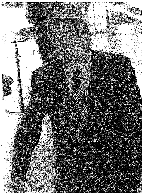
Besteht auf der alleinigen Sportgerichtsbarkeit: Thomas Bach in Bremen.